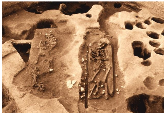
1・2号墓（右が1号墓、左が2号墓）