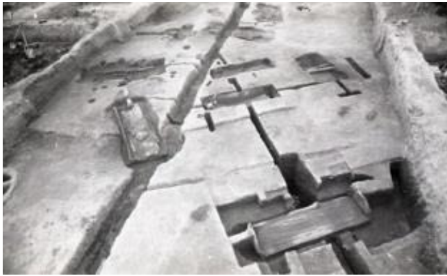
弥生墓地が見つかった様子