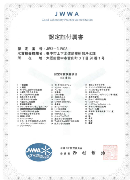
〔水道 GLP 認定証〕