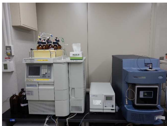
写真 2 高速液体クロマトグラフ質量分析計