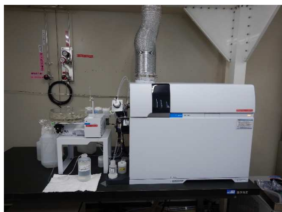
写真 1 誘導結合プラズマ質量分析計