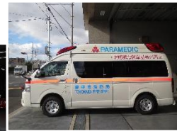
令和5年4月現在、南消防署で運用しています。