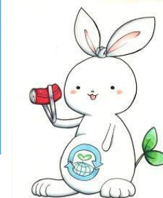
豊中市ごみ減量 PR イメージキャラクター