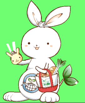
豊中市ごみ減量 PR イメージキャラクター