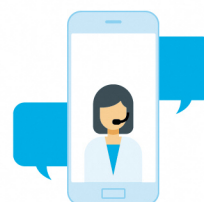
オンライン面談 (1回30~40分)