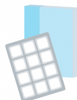
一般用医薬品 (ニコチンパッチなど)