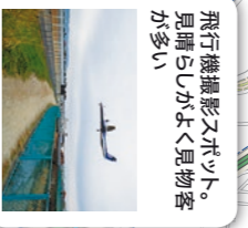
飛行機撮影スポット。見晴らしがよく見物客が多い

スカイランドHARADA スカイランドプラザ 原田処理場の屋上にある公園。広い敷地に芝生、目的の運動広場がある。大阪国際空港に隣接しており、飛行機の離発着を間近に見ることが出来る。 TEL: 06-6846-8181 営業時間: 9:00~17:00 園木種