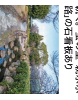
水路沿いの道がずっと続く。「螢の里」親水水路の石看板あり

緑と食品のリサイクルプラザ・緑化樹木見本園 みどりセンタープラザ 緑化センター 約150種の樹木を見本として植栽。「緑と食品のリサイクルプラザ」では、学校給食の生ごみと街路樹の剪定枝を堆肥化した「豊肥(とよひー)」を製造する。 TEL: 06-6840-6608(リサイクルプラザ) 06-6863-8439(緑化樹木見本園)