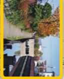
水路沿いにベンチ多数あり

夢の公衆浴場五色 あまのゆきいそぎ 昭和62(1987)年創業。年中無休24時間営業の銭湯。人工炭酸泉の檜風呂や露天の若風呂、温泉湯、サウナなど15の湯治施設がある。軽良が取れるうつくしーも人気。 TEL: 06-6331-4126 営業時間: 24時間 園木種