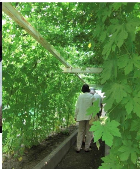
ぐんぐん伸びて、どんどん育つ!