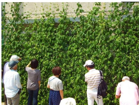
みどりのカーテンで 涼しい環境を作ろう!