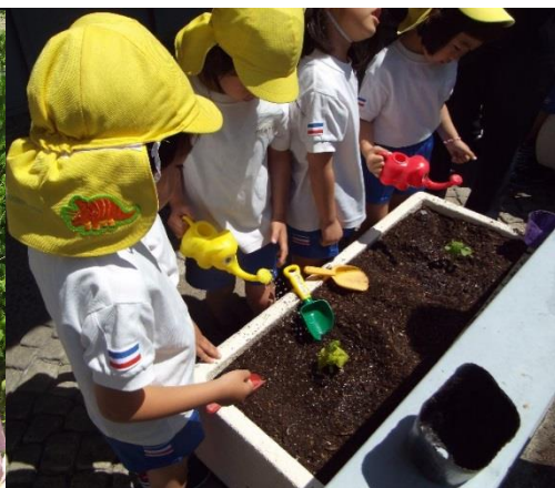
保育所やこども園の活動 にもぜひ!