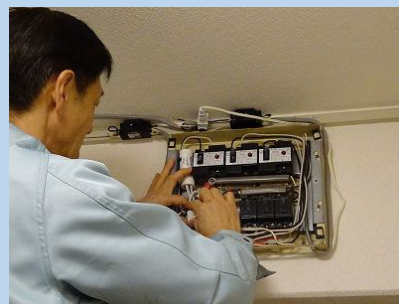
取り付けは20分程度