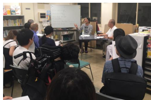
過去のちゃぶだい集会のようす