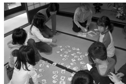
▼定期イベント「こども広場」 カルタ会の様子

「中世の城跡」と「昭和初期の和洋折衷の建物」という時代が重なり合った空間「原田城跡」と「旧羽室家住宅」が市民の手で保存活用されています。市から同施設の管理運営を受託している「とよなか・歴史と文化の会」は初期のころは、歴史文化というテーマに関心を持つ人たちの集まりでしたが、各地の先進事例を皆で見学に行き議論を重ねるたびに、保全と活用について能動的なかわり方をしようという機運が高まりました。旧羽室家住宅という活動拠点ができからは、会員それぞれが演じる側に立つことで、活動力・市民力を高める結果となりました。