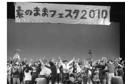
▼イベント 「素のままフェスタ2010」の様子

毎年2月に行われている「素のままフェスタ」は、プロからアマチュアまでさまざまなアーティストが歌やダンスなどを披露し観客と共に楽しむステージです。これを裏方で支えているのが、NPO法人パコです。「障害者の可能性の発掘」と「障害者の社会参加」を柱に、障害者の芸術活動を企画、演出、サポートしています。