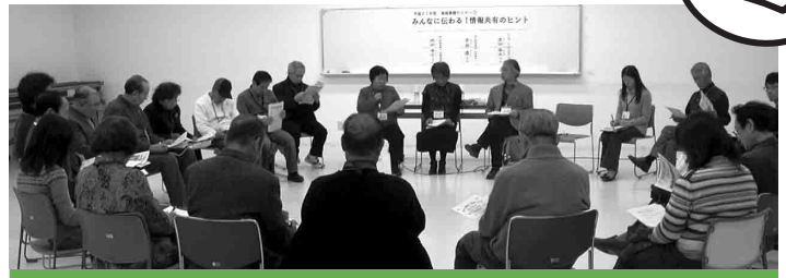
2月6日（土）千里公民館で開催（参加者23人）

新千里東町地域では、自治会、校区福祉委員会、公民分館、防犯協議会が合同で新聞委員会をつくり、地域の情報を1つにまとめて発行しています。前新聞委員のお二人に、委員会発足時のお話や編集の手順、コツなどを紹介していただき、参加者のみなさんと意見交換を行いました。また、地域ホームページの紹介もありました。