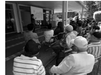
▼学生の研究成果の報告会。論文の図表をデザインした絵はがきもあります。

絵はがき制作を担うのは主に大学院生たちです。四季折々の風景から日常生活の一コマまで、ニュータウンのさまざまな姿をカメラに収め、得意のパソコン技術を駆使してデザインします。これまでに作成した絵はがきはおよそ500種類。鮮やかな紅葉の並木道や、古い写真と同じ場所で撮影して両者を対比させた団地風景などが、特に人気を呼んでいます。一方で、この数年の間にも団地の建替え等が進み、今では失われた風景も見られます。一枚の絵はがきが、住民の暮らしと共に心に刻まれた風景やまちの歴史、文化を見える形にし、まちの魅力として発信するとともに、新しく移り住んだ住民や次世代に受け継いでいく役割を果たしています。