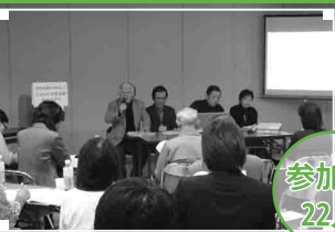
▼応募団体による公開プレゼンテーションの様子