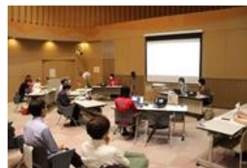
公開プレゼンテーションの様子