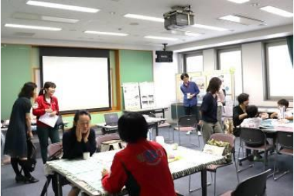
事業報告会の様子