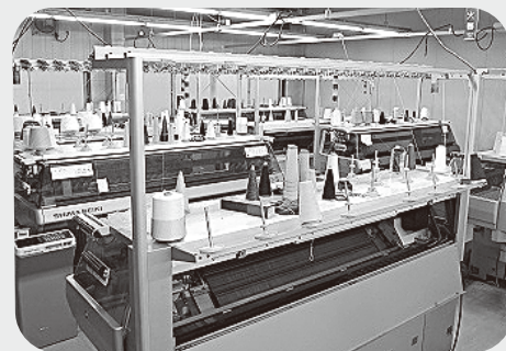
「匠ニット」編立工場