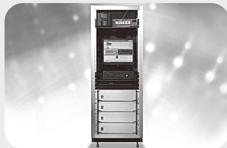
主力製品の充放電検査装置