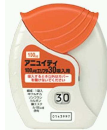
アニュイティ100エリプタ

* 写真はエリプタの一例であり、実物とは異なる場合があります。 アニュイティ100エリプタは右上の写真を参照して下さい。