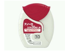
アノーロエリプタ

* 写真はエリプタの一例であり、実物とは異なる場合があります。 アノーロエリプタは右上の写真を参照して下さい。