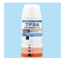
ブデホル吸入粉末剤