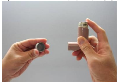
キューバール100エアゾール

* 写真はキューバール50エアゾールです。 キューバール100エアゾールは右上の写真を参照して下さい。