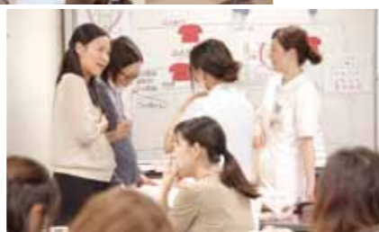
各レッスンの最後に産科病棟の見学・ご案内も。