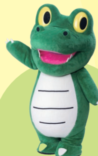
大阪大学 「ワニ博士」

会場 大阪大学総合学術博物館 待兼山修学館 (大阪府豊中市待兼山町1-20 大阪大学豊中キャンパス内)