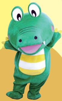
豊中市 「マチカネくん」