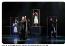
2014年度大阪音楽大学短期大学部 ミュージカル・コース 第4回公演会「ガラスの靴」

※ミュージカルワークショップのお申込み・日程など詳しくは、13ページ「因」をご覧ください。