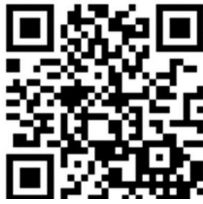
도요나카 국제교류협회 홈페이지

○큰 지진이나 태풍이 왔을 때, 페이스북에서 외국어 정보를 확인해 주세요.