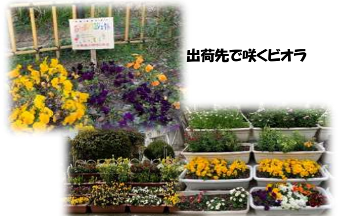
出荷先で咲くピオラ