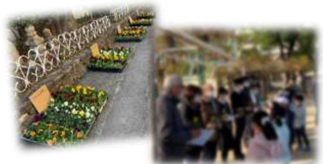
出荷式(地域の方に挨拶)