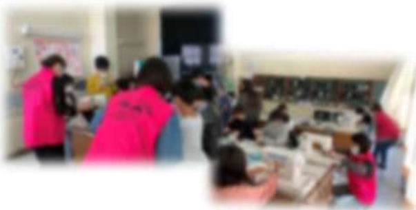
学習支援(6年ミシン)