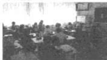
教室でオンラインでの読み聞かせを視聴する子どもたち(2年生)