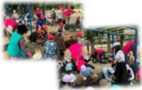
移植式(フラグ苗をポットに移しています)

＜学習支援＞今年度も、6年生の学習支援が実現しました。保護者の方が中心でしたが延べ20名のお母さんが、ミシンの学習のお手伝いに来てくださいました。子ども達は、日ごろ使い慣れないミシンに悪戦苦闘していましたが、先生以外の大人がいてくれることで、安心してミシン学習に取り組むことができました。