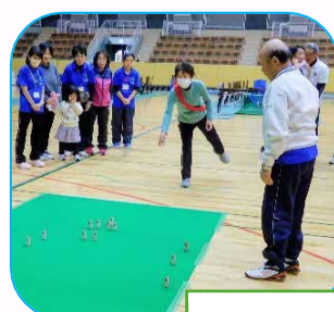
ミニらいとモルック