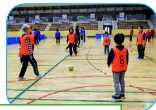
ウォーキングフットボール