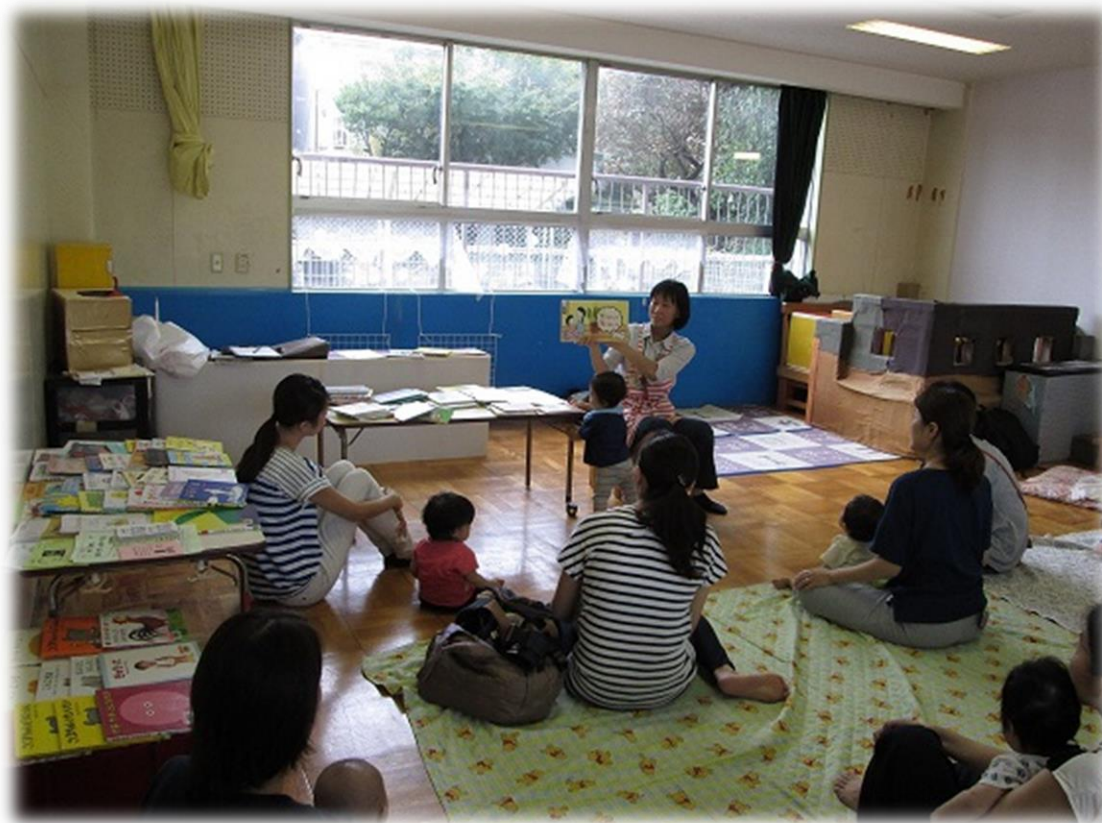
<地域の施設での絵本の読み聞かせ（出前講座）>