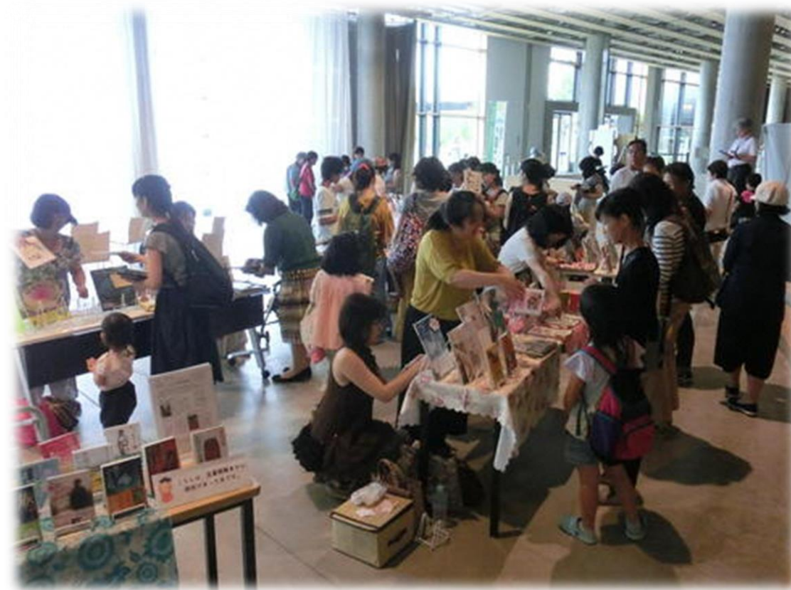
＜岐阜市立中央図書館『BookBook交歓会』の様子＞