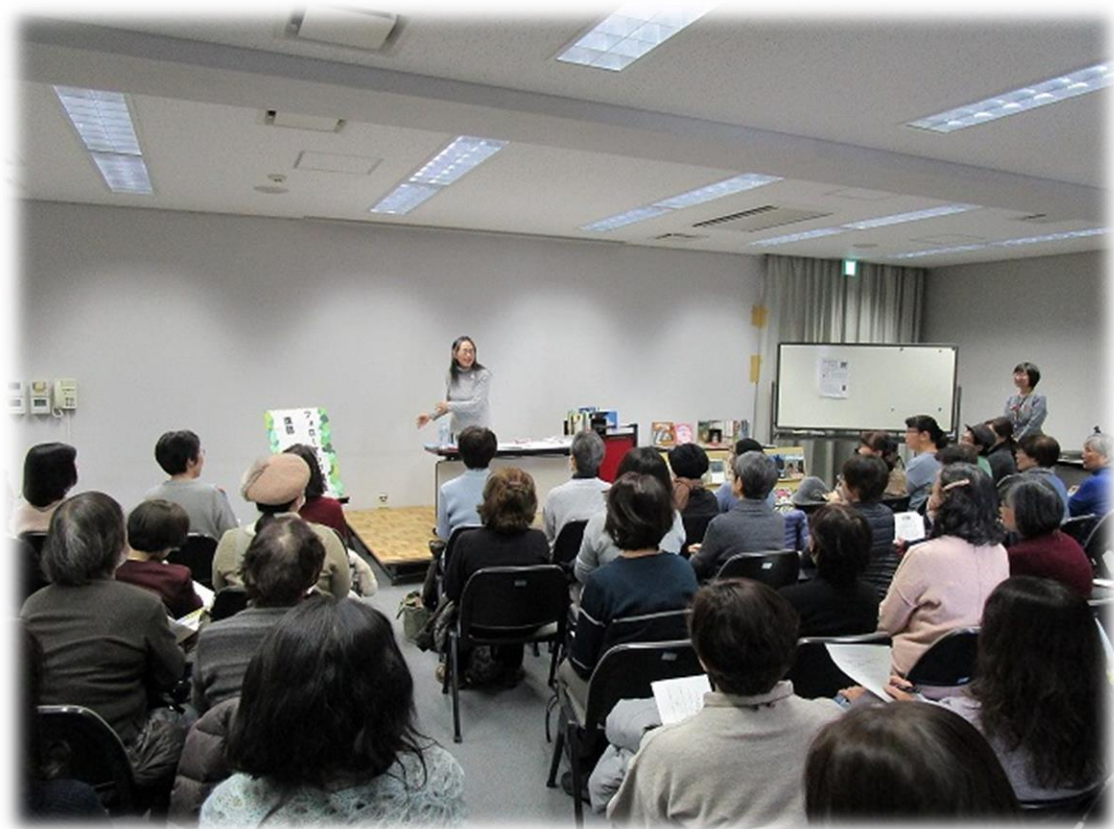
＜おはなしボランティア フォローアップ講座の様子＞