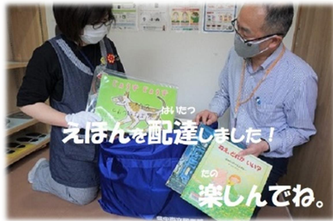
<通所支援事業所への配本（えほん配達便）>