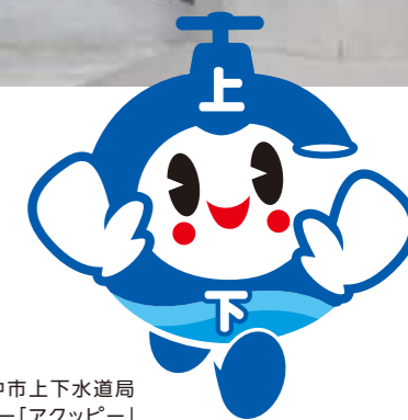
豊中市上下水道局 キャラクター「アックピー」

豊中市では、市域全域で水道・下水道が整備されていますが、高度経済成長期に整備された施設や水道管・下水道管が老朽化するなど、課題も出てきています。上下水道局では、これらの課題に対応しながら、将来にわたってお客さまに安全・安心な上下水道を提供できるよう、 第2次とよなか水未来構想 (→P.2・P.3)を策定し、さまざまな取り組みを進めています。