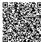
とよなかこころのサポーター