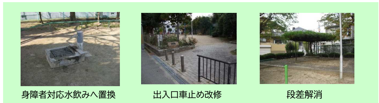
身障者対応水飲みへ置換