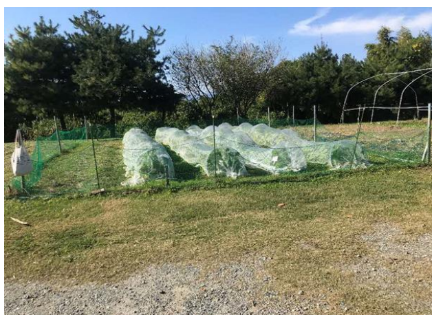
区画①（117.0㎡） 家族の部が使用