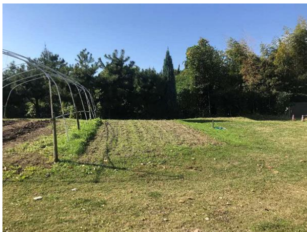
区画④（61.7㎡） 障害者就労移行支援事業所が使用