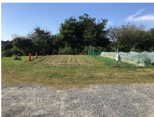
区画③（84.2㎡） 個人の部が使用 区画②（50㎡）※赤コーン左側