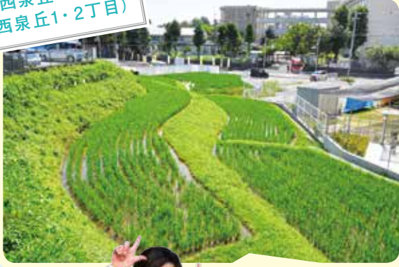
西泉丘の田園 (西泉丘1・2丁目)