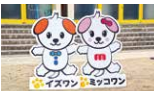
毎朝子どもたちを迎える同校のキャラクター・イズワンとミッコワン

児童が2人〜3人のグループになり、授業中話し合ったり、教え合ったりするほか、考えを文章として表現するなど、自ら考える主体的な学習に力を入れています。