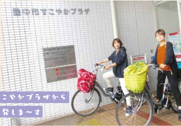
すこやかプラザから 出発しま～す