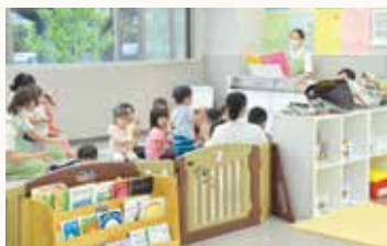
一時保育イメージ