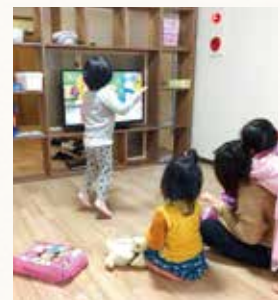
ショートステイイメージ