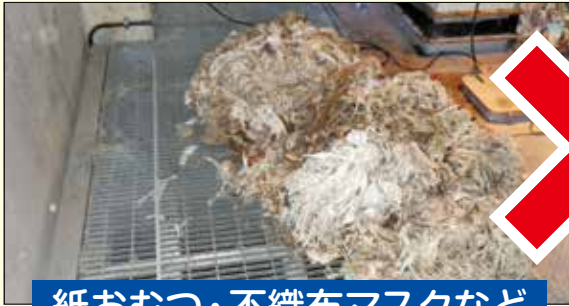
紙おむつ・不織布マスクなど