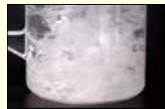
トイレットペーパー