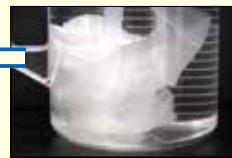
ティッシュペーパー

などJIS規格で定められたトイレットペーパーの基準をクリアしていないものがあるよ。このような紙を流すと、下水道管内で詰まったり、そのままの姿で処理場に流れ着いて、機械に絡まったりして大変なんだ。基準に満たない紙は、可燃ごみとして捨ててね!