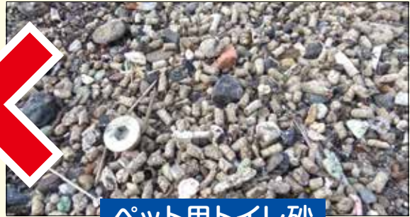
ペット用トイレ砂