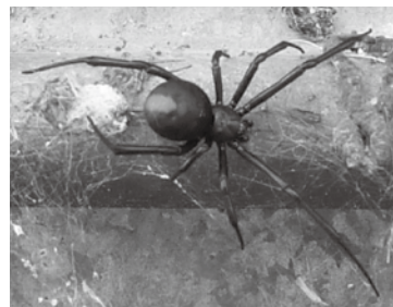
メスの成体。大きな腹部の背面にあるすじ状の赤い模様が特徴