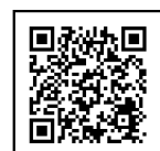
パズルの応募はこちらから