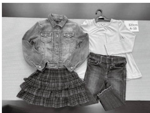
各サイズ20組を掲載しています

関まだ使える子ども服(80cm～120cm)を1世帯3組まで譲渡 関市在住の人 申1月23日(日)までに市HP。抽選あり 関家庭ごみ事業課 08043・3512