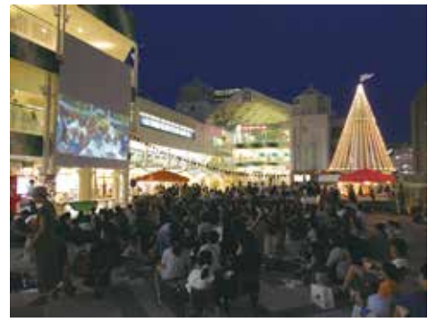
過去開催の様子(会場はせんちゅうパル)

時 4月29日(祝)18時～21時 所 まるたす広場(吹田市) 内 風の谷のナウシカ 対 100人 円500円 他 芝生広場や物販コーナーあり 申 4月17日(日)までに市HP。抽選 問 都市整備課 ☎858・2674