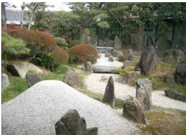
令和元年(2019)に府内で6番目の国名勝に指定されました

時5月28日(土)9時15分〜16時(見学期間は約30分。時間指定不可) 所 同庭園 対中学生以上、90人 申込 信先明記の往復はがき(1枚2人まで)に、共通、参加者全員の名前・年齢・電話番号を書き、〒561-8501「豊中市役所社会教育課」☎6858・2581。5月12日(木)消印有効。市HP可。抽選