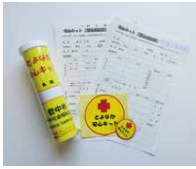
連絡票に緊急連絡先や病歴・通院状況などを記入して、冷蔵庫に保管してください