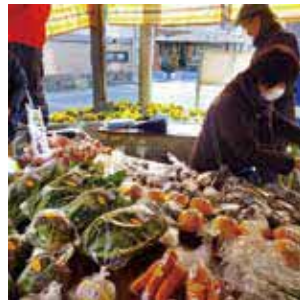
豊中産の野菜が並びます

時10月27日(木)・11月24日(木)10時〜売切れ次第終了 所さわ病院 他とよっぴー3kg(150円)、コメの有料配布あり