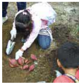
堆肥・とよっぴーで育てたサツマイモです

㉖ ① 10時〜② 11時 ㉗ ③ ④ ⑤ ⑥ ⑦ ⑧ ⑨ ⑩ ⑪ ⑫ ⑬ ⑭ ⑮ ⑯ ⑰ ⑱ ⑲ ⑳ ㉑ ㉒ ㉓ ㉔ ㉕ ㉖ ㉗ ㉘ ㉙ ㉚ ㉛ ㉜ ㉝ ㉞ ㉟ ㊱ ㊲ ㊳ ㊴ ㊵ ㊶ ㊷ ㊸ ㊹ ㊺ ㊻ ㊼ ㊽ ㊾ ㊿