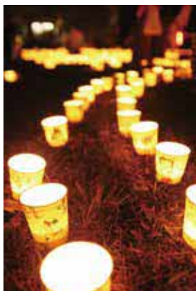
たくさんの小さな明かりがまちを彩ります

時 11月5日(土)16時～20時。荒天中止 所 千里南公園(吹田市) 内 キャンドルアート、竹明かりほか 問 都市整備課 ☎6858・2674