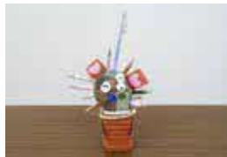
江本花埜さんの作品「おもい出ライオン」