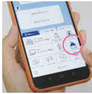
不具合状況が分かる写真、位置情報、確認した日時などを送っていただきます

市道や公園遊具の損傷、ごみの不法投棄、漏水などの不具合を見つけたり、市LINE公式アカウントの「道路・公園等不具合通報」をご利用ください。