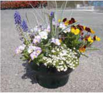
ムスカリなどを使って作る寄せ植え(過去の作例)