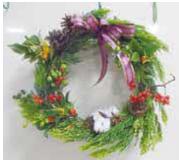
フジのつるを土台に自然素材で飾りつけていきます