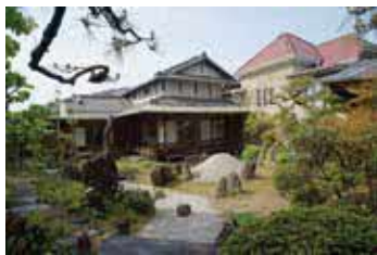
西山氏庭園と戦前の郊外住宅

時12月17日(土)9時15分〜16時(見学時間は約30分。時間指定不可) 所 同庭園 対中学生以上、90人 申市HPか、返信先明記の往復はがき(1枚2人まで)に共通、参加者全員の名前・年齢を書き、〒561-8501豊中市役所社会教育課☎68558・2581。12月7日(水)消印有効。抽選