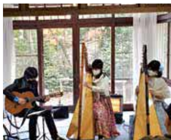
アルパとラテンギターの演奏

時①12月4日(日)②1月8日(日) 内む かし遊び(こま回し・けん玉ほかと ①バルーンアート、紙芝居②絵本の 読み聞かせ コンサート 時①12月10日(土)②12月24日(土)③1月 29日(日) 内①アルパとラテンギター ②スチールパン③バイオリン 対各 25人 ¥500円