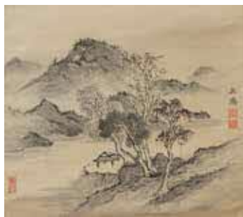
木村兼葭堂作・山水図(写真)、耳鳥齋作・福寿図を鑑賞します

内関西大学名誉教授・中谷伸生さんの解説による近世大阪に描かれた水墨画ほかの対話型鑑賞、遠州流茶道のお茶席 対13歳以上、20人 500円 申市HPか、はがき(1枚2人まで)に共通、参加者全員の名前・年齢を書き、〒561-8501豊中市役所魅力文化創造課☎6858・2876。12月6日(火)必着。抽選