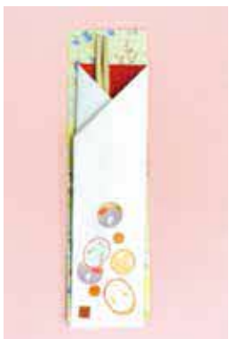
手作りの箸袋で新年を迎えませんか

①朗読鑑賞会 時12月8日(木)13時30分〜15時 所南ヶ原団地A号棟1ほか 対30人 ②正月用手作り祝い箸袋作り 時12月23日(金)13時30分〜15時 対60 歳以上、15人。小学生以下、5人。未就学児は保護者同伴