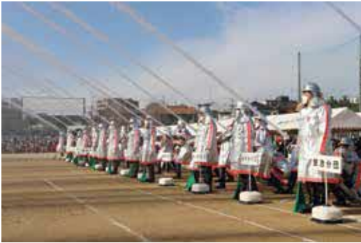
出初式の最後を締めくくると一斉放水は14の消防団が勢ぞろいします

時1月8日(日)10時～12時 所大門公園 内訓練展示、消防団一斉放水、箕面自由学園高校チアリーダー部の演技ほか 問消防局 ☎6853・2345