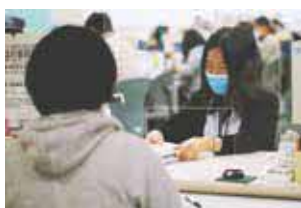
相談もお受けしています

☎マイナンバーの記入と本人確認書類の提示が必要。市外から転入し、豊中市の受診券と交換していない場合はいづれかのセンターに問い合わせ