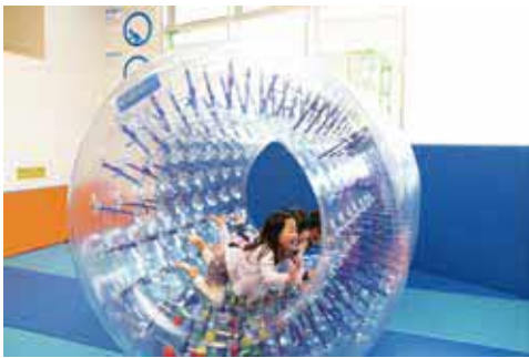
オープニングイベント限定の大型遊具。エントランススペースで遊べます

時 2月23日(祝)①大型遊具で遊ぼう 10時～15時 ②いろいろなおもちゃで遊ぼう ①10時～11時 ②13時～14時(各50分) 所 ①未就学児と家族 ②①0歳～2歳の①②3歳以上の未就学児と保護者、各20組 甲 ②2月3日(金)～15日(水)に市HPかほっぺ。抽選