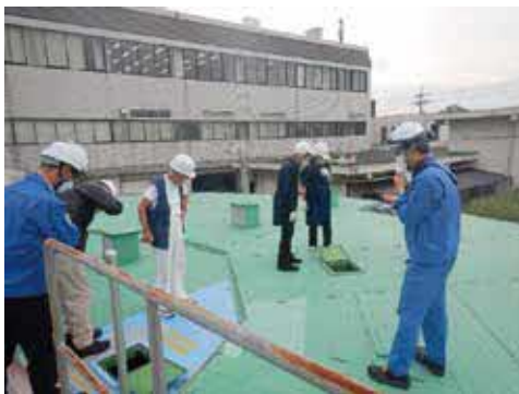
施設見学の様子。浄水処理の過程が間近で見られます

内 意見交換会や浄水場・下水処理場の見学など(平日に6回程度)。インターネットでのアンケート回答や意見提出ほか ▼ 期間 4月〜令和6年3月 対 市在住の18歳以上(4月1日時点)、30人 他 謝礼あり。利用機器や通信費用・交通費は自己負担 申 2月28日(火)までに市HP。選考あり 閩経営企画課 ☎ 6858・2921