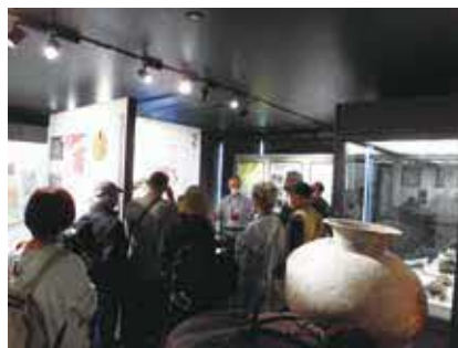
豊中の歴史を感じてみませんか

時2月1日(水)・11日(祝)・15日(水)・25日(土)10時30分〜11時 所 同館