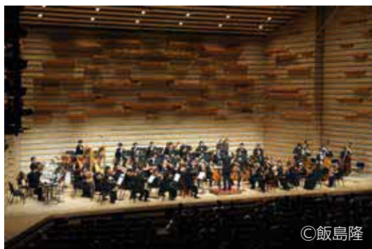
日本センチュリー交響楽団

時3月12日(日)13時30分〜16時30分 所青少年交流文化館いびき 内①棋 力レベル別対戦(3位以上に賞状進 呈)②関西棋院所属棋士が教える初 心者向け講座 対①小・中学生、30 人②小学生以上、8人 申2月19日 (日)までに市HP。抽選 問北摂こども 文化協会 ☎072・761・9 245