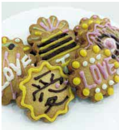
思いを込めてデザインしてみよう

時2月12日(日)10時～12時 所グリーンスポーツセンター 対小学生と保護者、8組 ¥千円 他市販のクッキーを使用 申2月4日(土)9時から同センター☎6398・7391に 来場。先着順