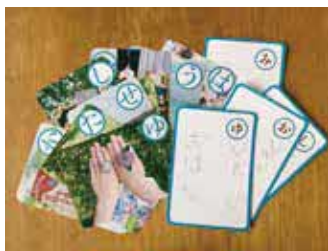
子どもかるたの制作例

時運3月①21日(祝)13時〜16時②25日(土)13時30分〜16時30分 所 ①都市緑化植物園②中央公民館 内 ①レクチャーを受けて写真撮影②取り札・読み札作りと展示準備 対 小学生以下の子どもと家族、10組(1組4人まで) 料 ①高校生以上、実費(入園料) 申 3月7日(火)までに市HP。抽選 問 魅力文化創造課☎6858・2551