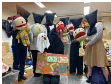
お話から人形まで、劇は全て団員の手作りです

時 2月26日(日)10時30分、11時30分 所 庄内コラボセンター「シヨコラ」 対 各20人 申 当日各15分前に会場。先着順 岡庄内図書館 ☎6334・1261