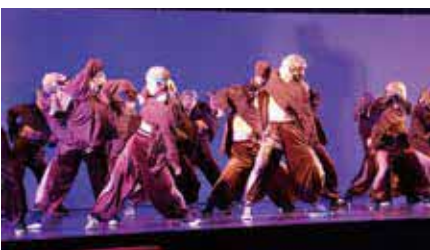
今年からはダンスに加え、和太鼓やバンド演奏などさまざまなジャンルのグループが参加します

時3月19日(日)14時～16時30分 所豊島体育館 内演奏やダンス 対千人 申当日会場。先着順 問青少年交流文化館いぶき☎6866・3030