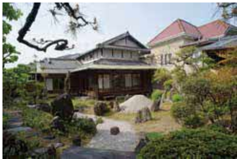
同庭園は令和元年(2019)に国指定名勝に指定されました

雨決行 所 同庭園 対 中学生以上、90人 申 市HPか、返信先明記の往復はがき(1枚2人まで)に共通、参加者全員の名前・年齢を書き、〒561-8501 豊中市役所 社会教育課☎6858・2581。3月9日(木)消印有効。抽選