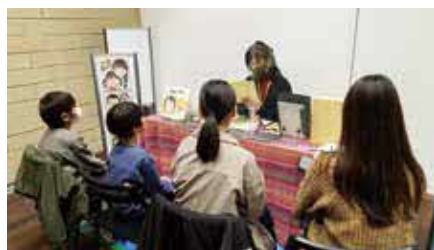
プロのアーティストに似顔絵を描いてもらおう

時3月18日(土)・19日(日)11時～16時 対各60人 ¥500円 申当日会場。先着順