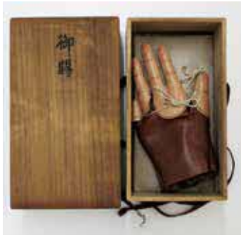
日中戦争に従軍し指を失った人に贈られた左手義指装具(市民寄贈)

時 3月29日(水)～5月26日(金) 内 市内に寄贈された海軍軍服やリュックサック、千人針ほか。期間中、展示品の入れ替えあり