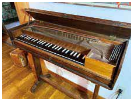
古典鍵盤楽器のクラビコード(1776年製)

市HPか、はがきに共通、①か②、参加人数(①2人まで②3人まで)、全員の名前(ふりがな)・年齢を書き、〒561-8501 豊中市役所 魅力文化創造課。3月6日(月)必着。抽選