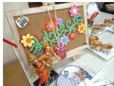
タイのお菓子販売コーナーの様子

時 3月25日(土)10時～15時 所 同センター 内 登録グループ活動発表、子どもの民族衣装体験、世界の食べ物などの販売ほか