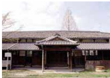
明治33年(1900)に建てられた同校舎は、増改築しながら昭和48年(1973)まで使われていました

時3月11日(土)・12日(日)10時～12時、13時30分～16時 所同校舎 内府指 定文化財かつ現存する府内最古の木造校舎で、明治から昭和までの教科書、蓄音機や石盤などを展示 問社 会教育課☎6858・2581