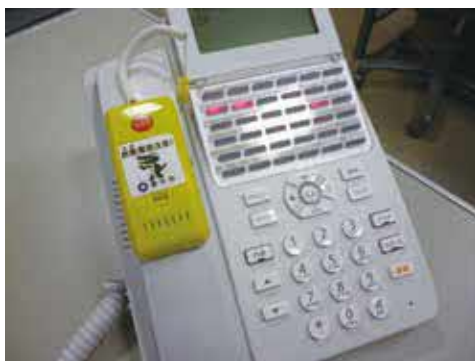
振り込め詐欺被害防止の警告音声の流れます

時 4月11日(火)14時〜、19日(水)10時〜、27日(木)14時〜 所 くらしかん 他 取り付け説明あり 申 くらしかん 課 ☎6858・5073