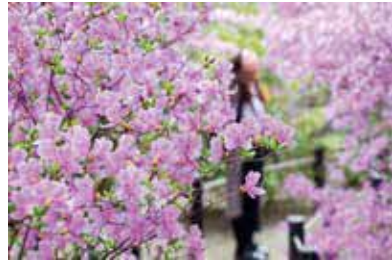
赤紫の花を咲かすコバノミツバツツジが見られます

時 4月5日(水)～16日(日)9時30分～16時 所 同園 閩公園みどり推進課 ☎6843・4000