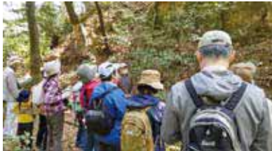
サクラやツツジなどの花を観察します

時 4月8日(土)9時30分 旧千里少年文化館集合 11時現地解散 閩緑地の散策、動植物・昆虫観察 対 20人 申 4月3日(月)から公園みどり推進課 ☎6843・4141。先着順