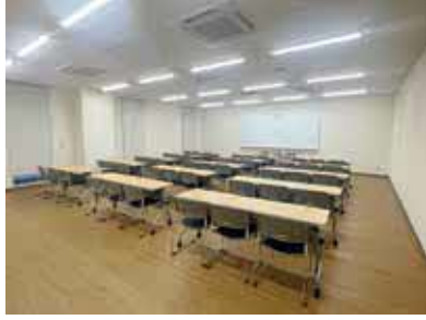
静かな環境で勉強しませんか