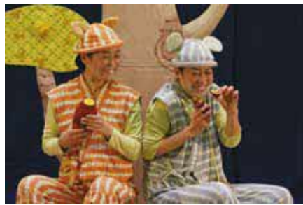
民族芸能アンサンブル若駒

時 6月10日(土)10時〜11時30分 所 ローズ文化ホール 内 手遊び歌やお芝居 対 0歳〜2歳の子どもと保護者、各70人 ¥親子ペア千円ほか 申 4月20日(木)から同ホール ☎ 6331・7961。先着順