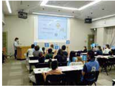
ヒメボタルについてクイズで楽しく学びます

時 5月20日(土)・27日(土)19時30分〜21時 所 野畑小学校ほか 内 豊中のヒメボタルと保全活動の話、クイズ、現地での観察ほか 対各50人 申5月1日(月)〜12日(金)に電話で公園みどり推進課☎6843・4141。先着順