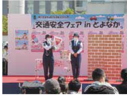
楽しみながら交通安全について学ぼう

交通安全教室、市消防音楽隊の演奏、一日警察署長によるエレフトーン演奏ほか 問 交通政策課 ☎6858・2534