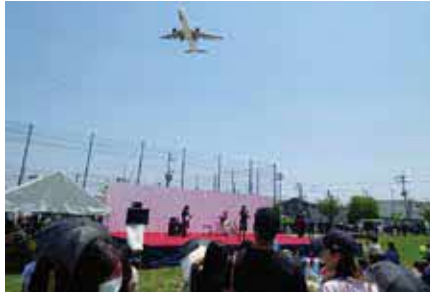
高校生によるダンスやバンド演奏などのステージ発表

時 5月3日(祝)11時～15時 所 ふれあい緑地 内 ステージ、飲食ブース、野菜・花苗販売ほか 問 公園みどり推進課 ☎6843・4000