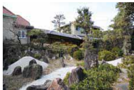
同庭園は令和元年(2019)に国指定名勝になりました

時5月28日(日)9時15分～16時(見学は約40分。時間指定不可)。小雨決行 所同庭園 対中学生以上、100人 申市HPか、返信先明記の往復はがきに共通、参加者(2人まで)の名前・年齢を書き、〒561-8501豊中市役所 社会教育課 ☎6858・2581。5月11日(木)消印有効。抽選