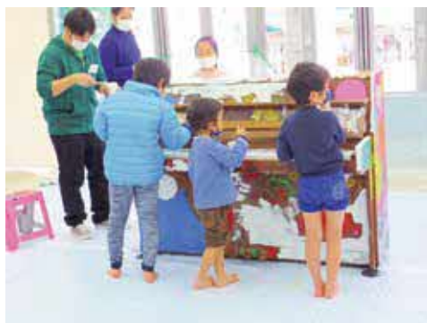
完成したピアノはコンサートで使用したり市内を巡回したりします