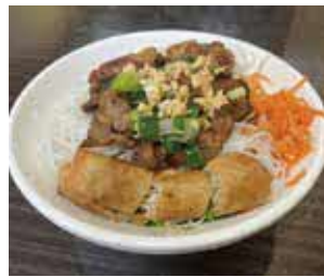
豚肉をのせた汁なし麺、ブン ・ティット・サオ

時 6月29日(木)10時〜13時30分 所と よなか国際交流センター 内 同国 出身の講師と料理を作って交流 対 10人 ☎千800円 申 6月5日(月)か ら同センター ☎68443・434 3。先着順