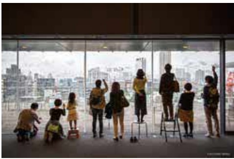
窓の向こう側に見える景色を窓ガラスに特殊なマーカーで描きます