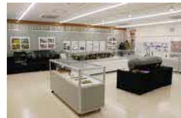
戦争遺品や1トン爆弾の実物大模 型などが展示されています