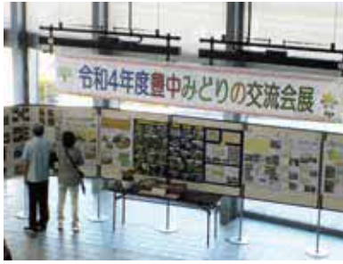
過去の同イベントの様子

時 6月8日(木)・9日(金)10時～16時 所 市役所第二庁舎 ㊦みどりに関する活動紹介や花とみどりの名所マップのパネル展示ほか ㊦花苗・ゴーヤ苗の配布あり(各日先着100人) ㊦公園みどり推進課 ☎6843・4141