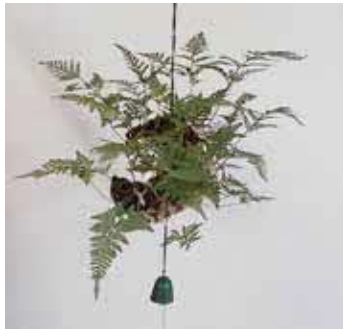
つりしのぶで暑い夏を涼やかに演出しよう