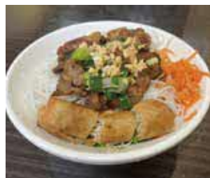
豚肉をのせた汁なし麺、ブン ・ティット・サオ

時 6月29日(木)10時〜13時30分 所と よなか国際交流センター 内 同国 出身の講師と料理を作って交流 対 10人 ☎千800円 申 6月5日(月)か ら同センター ☎68443・434 3。先着順