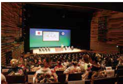
令和4年度成人式の様子 友達同士の申し込みも大歓迎です

☎令和6年1月8日(祝)に開催の成人式の企画ほか、記念式典での誓いの言葉や花束受贈などを担当。8月の平日に第1回会議あり ☎平成15年4月2日～平成16年4月1日に生まれた人 ☎7月31日(月)までに市HPか電話で社会教育課 6858・2582