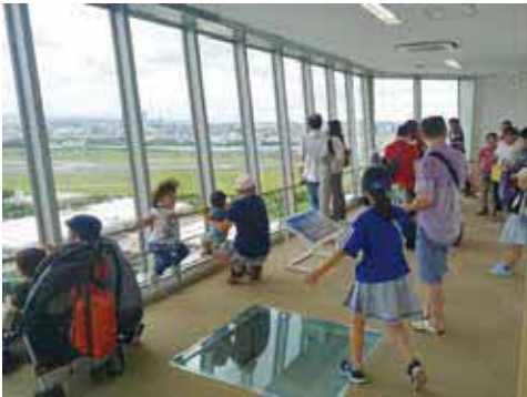
過去の展望フロア一般開放の様子

時7月16日(日)・8月20日(日)10時～15時 ④ごみ焼却施設見学 ⑤10時15分～、10時30分～、13時30分～。各15人。当日会場。先着順(家具リユースコーナー)不用となり持ち込まれた家具の展示・無料譲渡。11時30分まで受け付け。11時45分に抽選。